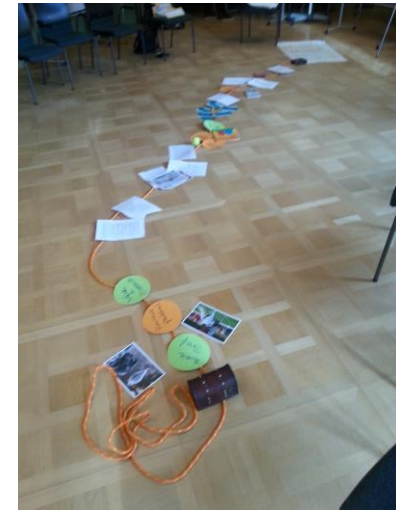
Supervision heißt Draufsicht

Als systemische Supervisorin und Coachin begleite ich Prozesse mit einem ganzheitlichem Blick. Die Lösungen sind in den Menschen, im gesamten Team vorhanden. Manchmal müssen Ressourcen erst oder neu entdeckt werden.